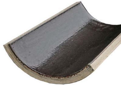
KERA.Base 1/3 schaal