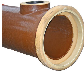
KERA.Base compacte aftakking