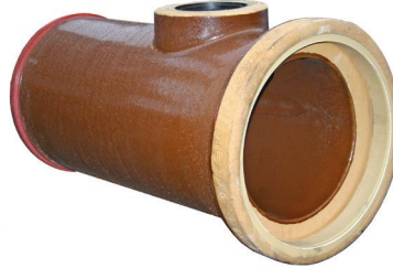
KERA.Pro compacte aftakking