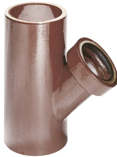
KERA.Pro mofloze aftakking 45°